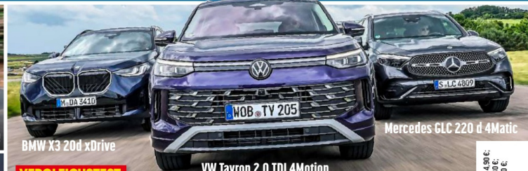
BMW X3 20d xDrive