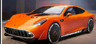
VORSTELLUNG MERCEDES-AMG GT XX Neuer Mega-Sportler mit 1360 PS