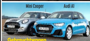
Gebrauchtwagen Edle Kleine mit Top-Bewertung