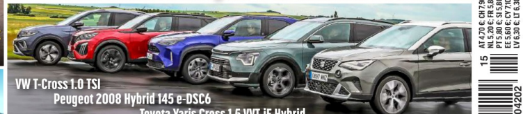
VW T-Cross 1.0 TSI