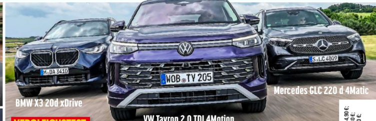
BMW X3 20d xDrive