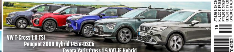
VW T-Cross 1.0 TSI