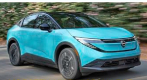
VORSTELLUNG NISSAN LEAF Frisch in Form: 600 Kilometer Reichweite