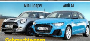
Gebrauchtwagen Edle Kleine mit Top-Bewertung