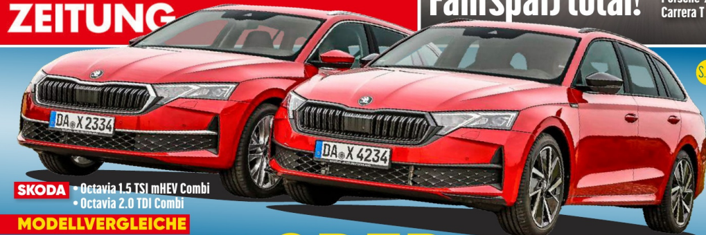
SKODA • Octavia 1.5 TSI mHEV Combi • Octavia 2.0 TDI Combi