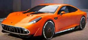
VORSTELLUNG MERCEDES-AMG GT XX Neuer Mega-Sportler mit 1360 PS