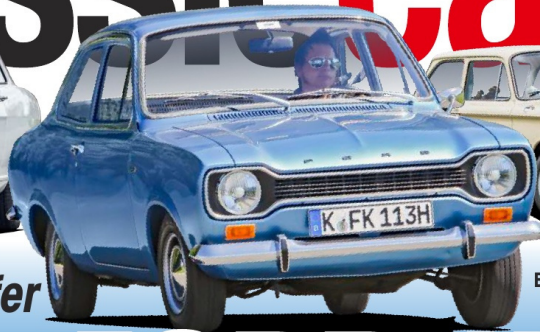
ESCORT 1300 L