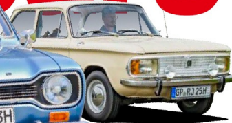
NSU 1200 C