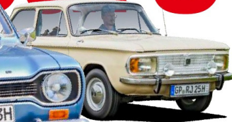
NSU 1200 C