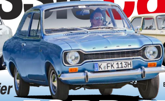
ESCORT 1300 L