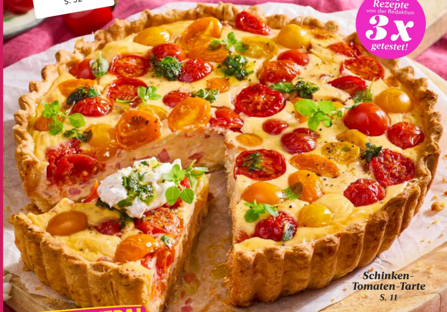
Schinken- Tomaten-Tarte S. 11

Alle Rezepte von der Redaktion 3x getestet!