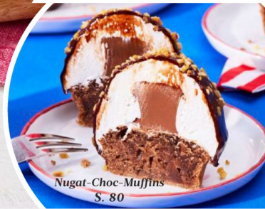
Nugat-Choc-Muffins S. 80