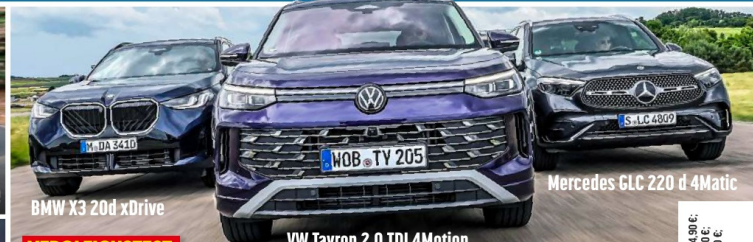
BMW X3 20d xDrive