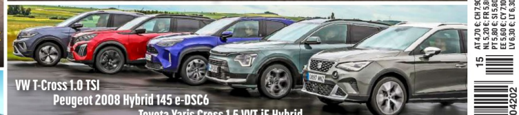
VW T-Cross 1.0 TSI