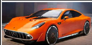
VORSTELLUNG MERCEDES-AMG GT XX Neuer Mega-Sportler mit 1360 PS