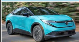
VORSTELLUNG NISSAN LEAF Frisch in Form: 600 Kilometer Reichweite