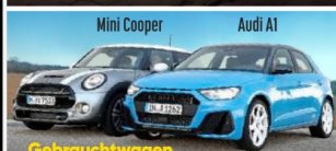
Gebrauchtwagen Edle Kleine mit Top-Bewertung