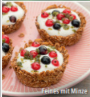
Feines mit Minze

AL 5 317 01 8 30 04 10 4 ISSN 1620-8446 P 7,90 € StD 420 € | 2019