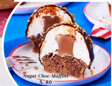
Nugat-Choc-Muffins S. 80